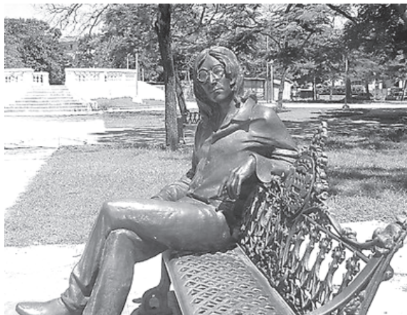
Памятник Джону Леннону в парке имени Джона Леннона в Гаване.