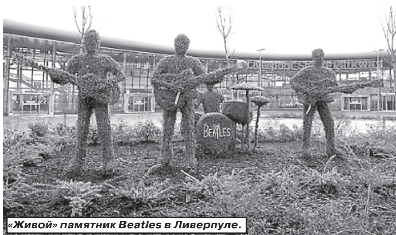
«Живой» памятник Beatles в Ливерпуле.