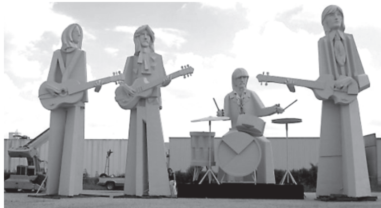
Этот памятник в Хьюстоне почему-то сильно критикуется... особенно за его гигантские размеры. Высота монумента около 12 метров (привет Церетели).

Кстати, в этом памятнике фигур не четыре, а пять: Пол