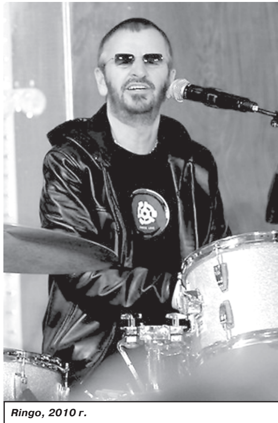
Ringo, 2010 г.

Ринго Старр стал и первым поющим барабанщиком. Как и первым Битлом, музистившим сольный альбом - в марте 1970 г.