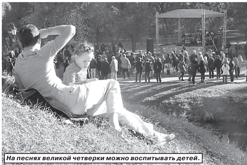
На песнях великой четверки можно воспитывать детей.

По ходу концерта организаторы и музыканты торжественно сняли белую полупрозрачную