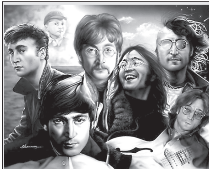
Джон Леннон родился 9 октября 1940 года во время жестокой бомбардировки Ливерпуля. Ему дали второе имя Уинстон - как дань патриотизму.

9 октября многие пришедшие в парк «Юность» удивлялись, на-